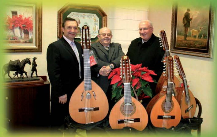
Col·lectiu pro defensa de l'Alb6