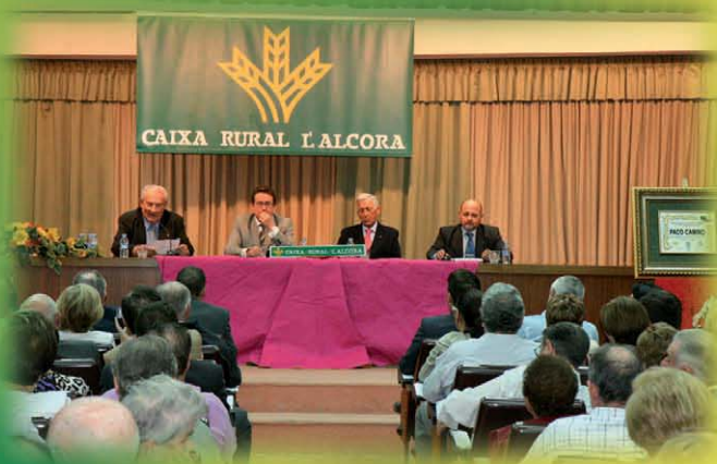
Conferencia coloquio toreros de 6poca