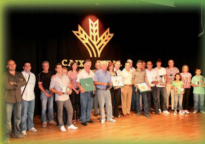
XV concurs reclam de boca