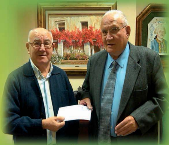
Colaboracion C6ritas Parroquial