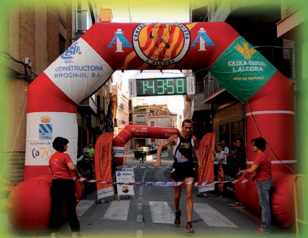
IV mitja marat6