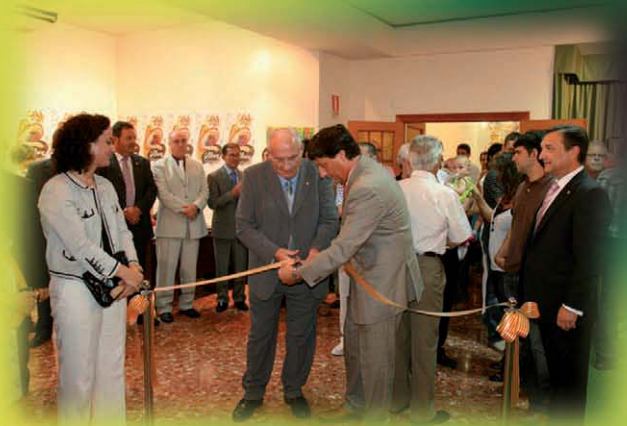
Exposicion fiestas Stmo. Cristo