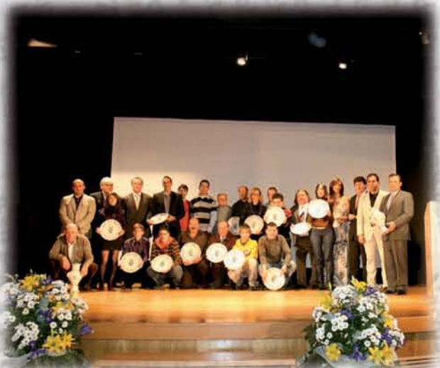
Entrega de premios gala del deporte