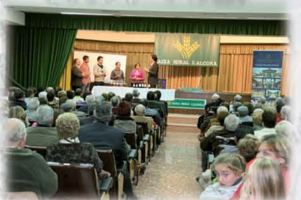
Conferencia-coloquio cata de vino