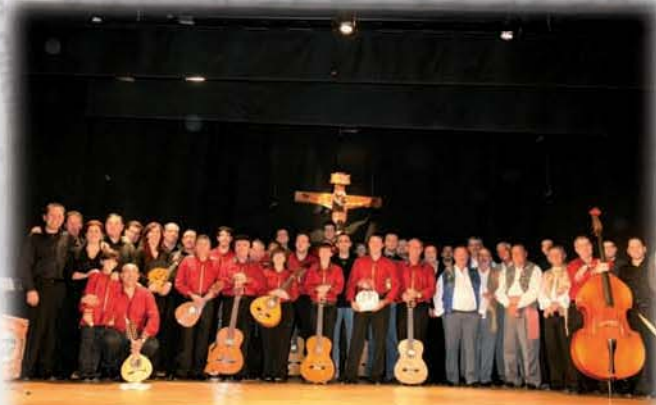
Actuaciones culturales en el auditorio