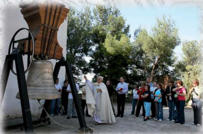
Colaboración en la restauración de la Campana San Cristóbal