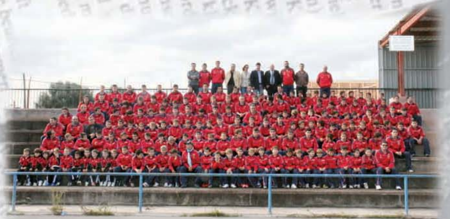
Nuestro apoyo al deporte local