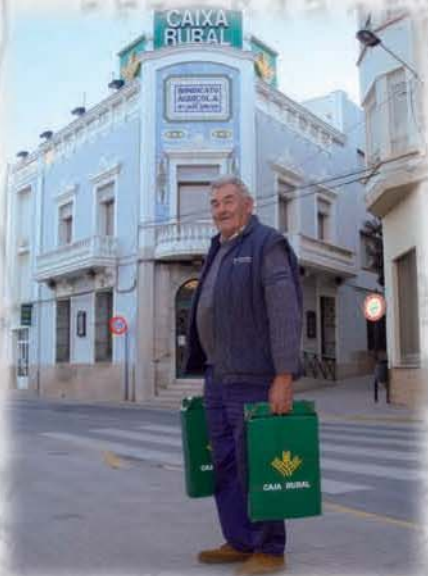
Colaboración con las asociaciones de Jubilados y Pensionistas